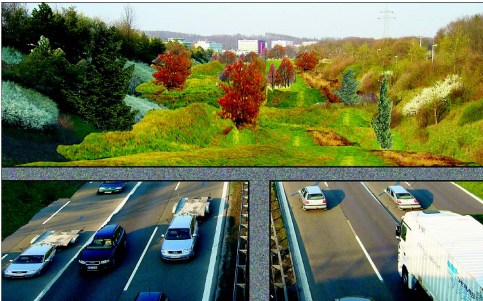
Auf einem Betonbauwerk eine begehbare grüne Oase: Könnte so die Überdeckung der A 81 zwischen Böblingen und Sindelfingen aussehen? Wie man effektiven Lärmschutz optisch ansprechend verpackt – das soll die Infoveranstaltung am Donnerstagabend in der Aula des Goldberg-Gymnasiums klären helfen.