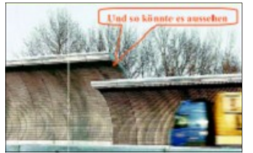
So sehen die gebogenen Lärmschutzwände vor und hinter dem Deckel aus