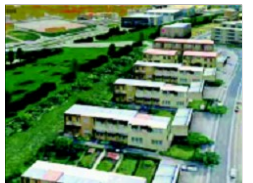
Blick über die Eschenbrunnlestraße aufs Grün

Ja. Diese bekommt auch die Bürgerinitiative zu sehen. Wir machen nichts, was nicht besprochen wäre. Es soll und muss doch alles funktionieren.