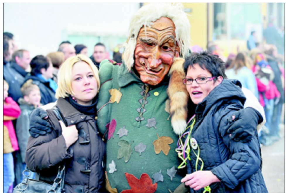
Die Schönen und das Biest beim Hausemer Fasnetsumzug

Nicht jede Hexe geht so subtil vor. Vorzugsweise junge Mädchen müssen so allerhand direkte Maßnahmen über sich ergehen lassen. Mehrere Duschleinheiten mit Konfetti gehören zum Standard. Und Schminken mit dicken roten, grünen oder schwarzen Stiften auch. „Nicht in die Haare!“ ruft ein kleines Mädchen, als ihre große Schwester zum x-ten Mal dran glauben muss und von einer Hexe mit roter Farbe überfallen wird. Manche Hexen haben schwarze Farbe direkt an den Händen und seifen damit ihre Auserwählten ein. Die Steigerung ist dann