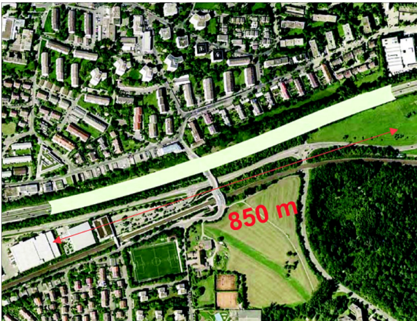
Zwischen dem DRK in der Waldenbucher Straße und dem Bitzer-„Schauwerk“ soll der Deckel verlaufen

Waren Sie schon vorm 18. November, der Goldberg-Versammlung, auf Konsenslinie? Ja, schon in der Woche davor. Sonst wäre