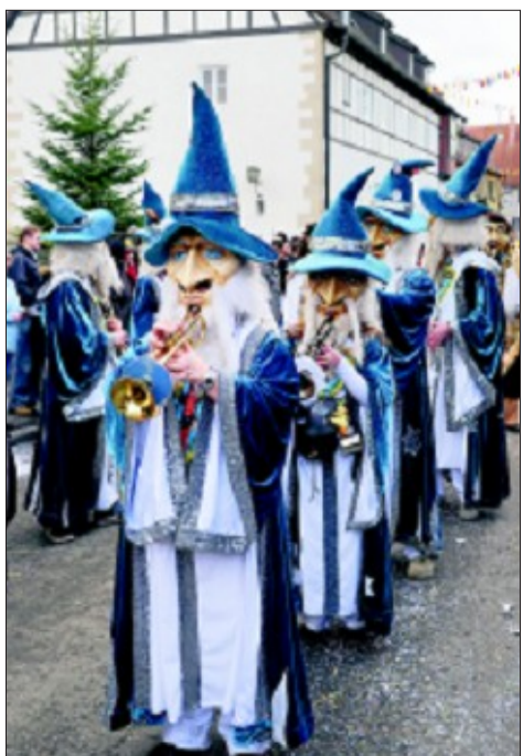
Hingucker: die Ehninger Guggenmusik

Plötzlich ist von dem wilden Treiben nichts mehr zu sehen. Eine dicke Rauchwolke schwebt in den Gassen unterhalb der